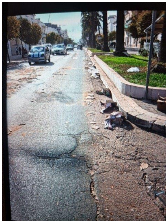
Alcune Foto dell'1 gennaio 2023 (corso Umberto I angolo via Maffei):